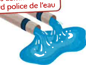
Remplissage / vidange des plans d'eau

INTERDIT sauf usages commerciaux après accord police de l'eau