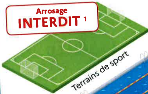
Terrains de sport