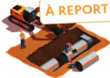
Travaux en cours d'eau