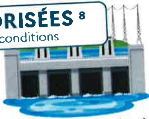
Installations de production d'électricité d'origine hydraulique