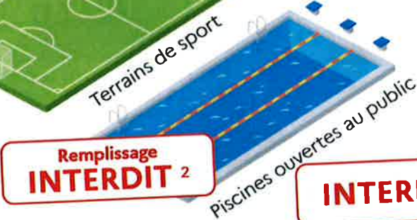
Piscines ouvertes au public

INTERDIT sauf usages commerciaux après accord police de l'eau