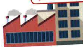
Installations classées pour la protection de l'environnement (ICPE)

Mesures prévues dans l'arrêté préfectoral ou dans l'arrêté ministériel